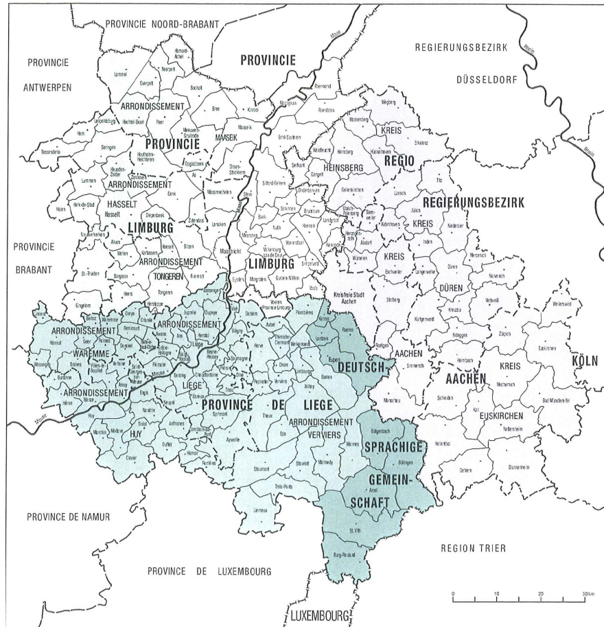
Fig.4 Ligging van de regio Zuid-Limburg in de Euregio Maas-Rijn

Dit heeft grote consequenties voor de rampenbestrijding. Enerzijds is de regio namelijk voor bijstand bijna geheel aangewezen op de aangrenzende landen, terwijl anderzijds de risico's op het grondgebied van de aangrenzende landen grote gevolgen kunnen hebben voor de eigen regio. Een goede euregionale samenwerking is derhalve één van de meest belangrijke succesfactoren voor de rampenbestrijding in Zuid-Limburg.