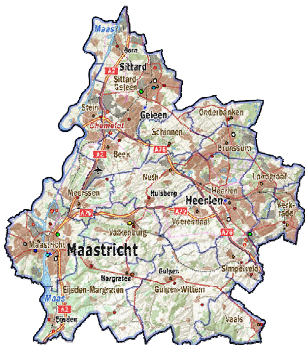
Fig. 2 Zuid-Limburg

In dit hoofdstuk worden de kenmerken van de regio Zuid-Limburg getypeerd qua geografie, gemeenten en ligging ten opzichte van de binnen- en buitenlandse buurregio's.