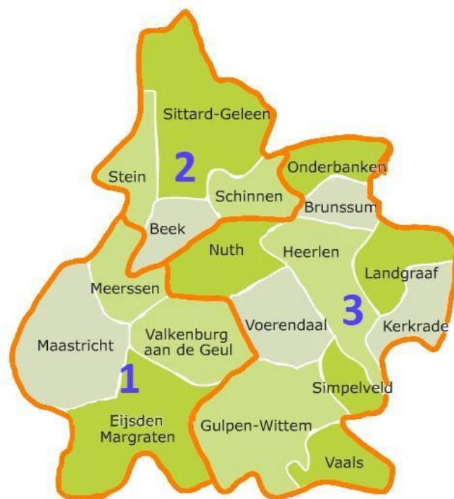
Fig.3 Overzicht gemeenten Zuid-Limburg

De regio kenmerkt zich als een compact verstedelijkt gebied van 30x30 km. Er zijn grote industrieën met specifieke veiligheidsrisico's zoals chemische industrie (Chemelot) en er is een luchthaven (Maastricht-Aachen Airport). Er zijn veel grootschalige (sport-, cultuur- en/of historische) evenementen, waterrecreatie, wekelijkse markt- en winkeltoeristen uit de Euregio Maas-Rijn en drugstoeristen uit verschillende Europese landen. Verder komen met name in de zomermaanden veel toeristen naar de regio.